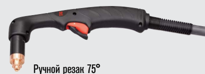
Ручной резак 75°

(дополнительные варианты резаков см. на веб-сайте www.hypertherm.com )