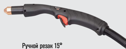
Ручной резак 15°